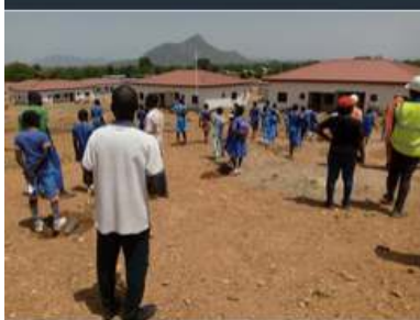
TERRE DES JEUNES CAMEROUN Activités du 40e au Cameroun