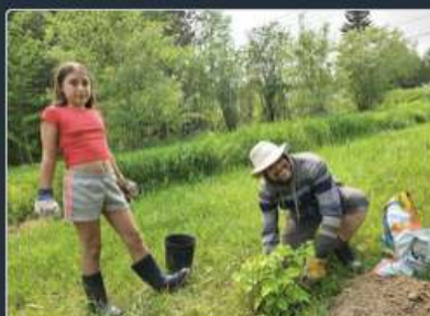
QUÉBEC Le C.A. mondial de TDJ met la main à la pâte!