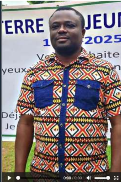
TOGO Célébrations du 40e de TDJ au Togo