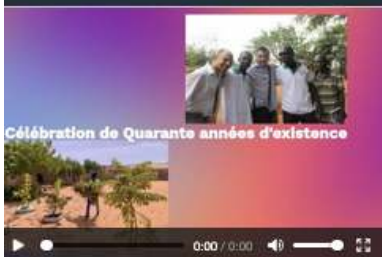
MONDIAL Le Réseau Terre des jeunes plus fort que jamais