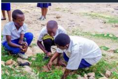
SOLIFEDE Activités en R. D. Congo