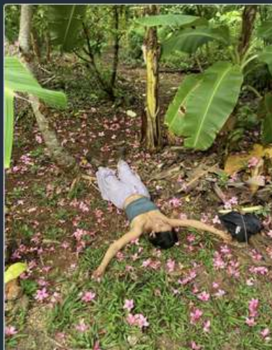
TIERRA DE LOS JÓVENES EN MÉXICO La Fête de l'arbre du 40e au Mexique