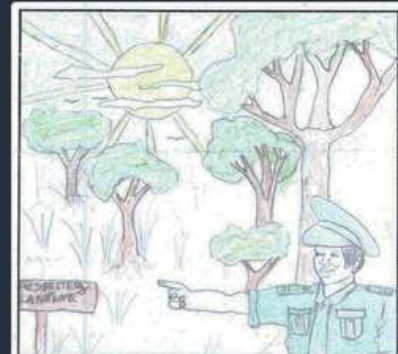
CÔTE D'IVOIRE Exposition de dessins en Côte d'Ivoire