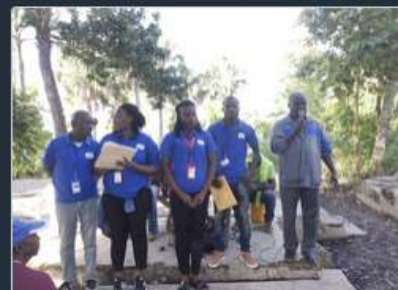
TDJ/JEAN-RABEL, HAÏTI Activités du 40e à Jean-Rabel en Haïti