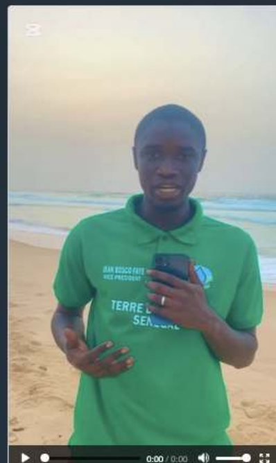
SÉNÉGAL Vidéo de TDJ Sénégal