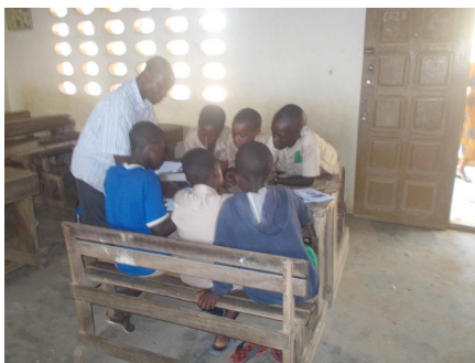
Figure 4 Les élèves en atelier à BINGERVILLE