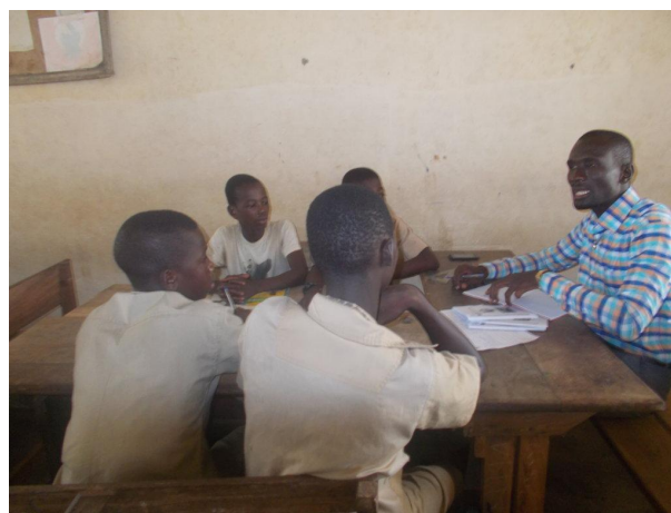
Figure 7: L'étape de DABOU sous la supervision de la direction régionale de l'environnement et du développement durable