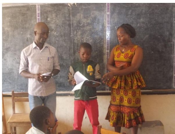
Figure 6: Les élèves de MAN en ateliers avec leur éducatrice et lors de la proclamation des résultats de l'atelier