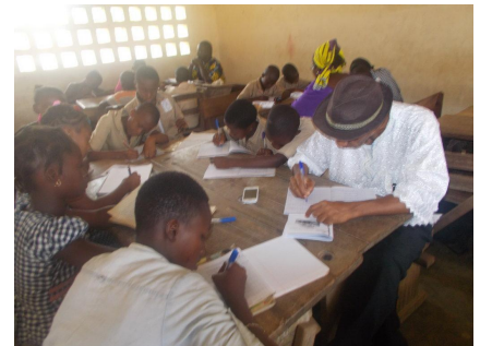
Figure 4 Les élèves en atelier à DABOU