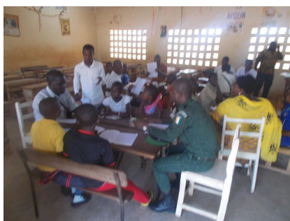
Figure 4 Les élèves en atelier à KORHOGO