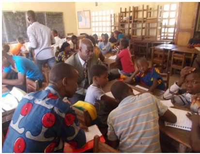
Figure 4: Les élèves en atelier à MAN

La troisième partie relative aux techniques de mise en place et gestion des pépinières en milieu scolaires a été à la différence des années passées, théorique car les graines dont nous disposions n'étaient prêtes pour être mises sur planche et/ou en sachets.