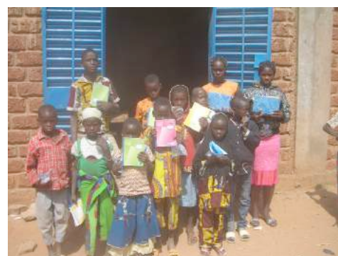
« Vue des participants munis de kits de sensibilisation »