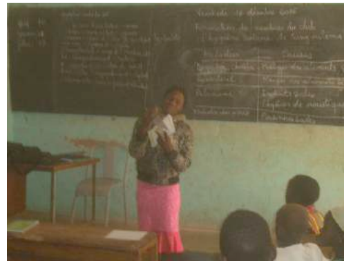
« Simulation de sensibilisation par un membre du club »

Les simulations ont porté sur la technique de conduite de sensibilisation de grand groupe sur les bonnes pratiques en matière d'hygiène de l'eau de boisson et d'assainissement.