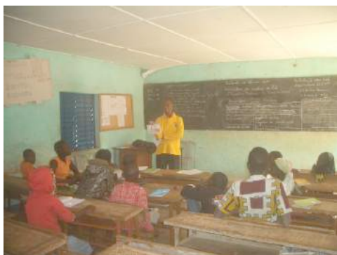
« Simulation par le formateur »

Il faut noter que ces séances pratiques ont permis aux participants de bien maîtriser la conduite des réunions de sensibilisation de grand groupe.