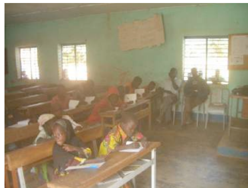
« Vue des participants »

Les travaux de groupe ont essentiellement porté sur la définition du rôle du club, des tâches des différents membres et la conduite de réunions de sensibilisation de grand groupe.