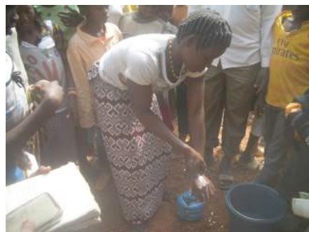
« Simulation lavage des mains par une participante »

Au cours de la formation, les élèves ont élaboré avec l'aide des enseignants leur plan d'action. Ce plan est consigné dans le tableau ci-dessous :