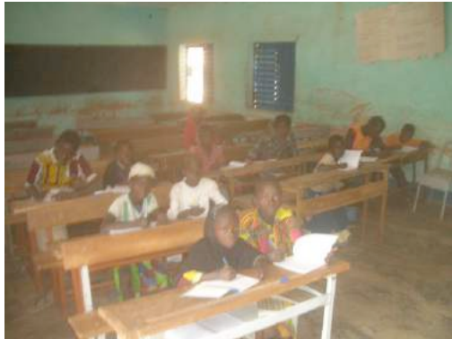
« Vue des participants »